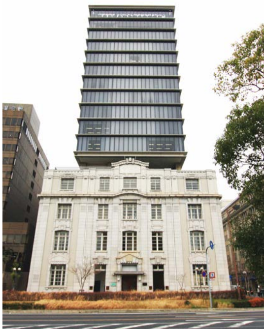
シップ神戸海岸ビル

当社はブランドの軸である「天然無垢材」を気軽に体験いただく空間として、東京、横浜、大阪、京都、福岡、そして先日1月26日にオープンした名古屋と全国でショールームを展開しています。この度の神戸での開業は7店舗目の出店となり、また、3月には東京・表参道での開業も予定しています。神戸元町ショールームは関西エリアでの市場拡大を目的に、ファイナンスから設計施工までのワンストップサービス「クロニクルプラス」、付加価値を追求したリノベーション住宅商品「ログマンション」の普及をはかります。