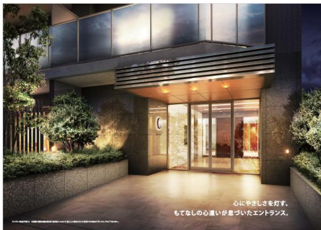
※「プロスタイル南町田」完成予想CG